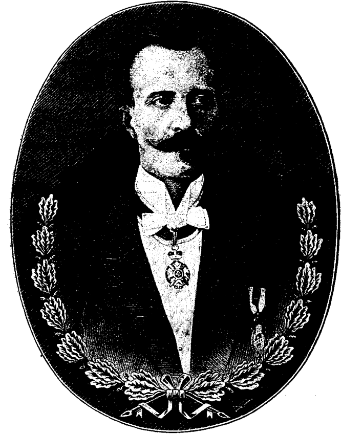
ВЕЛИКИ ПРОСВЕТНИ ДОБРОТВОР ДИМИТРИЈЕ СТАМЕНКОВИЋ ВИВ. ТРГОВАЦ БЕОГРАДСКИ (1845—1899)