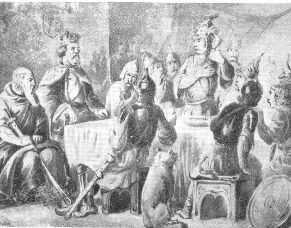
Анастас Јовановић, КОСОВСКА ВЕЧЕРА (Музеј града Београда)