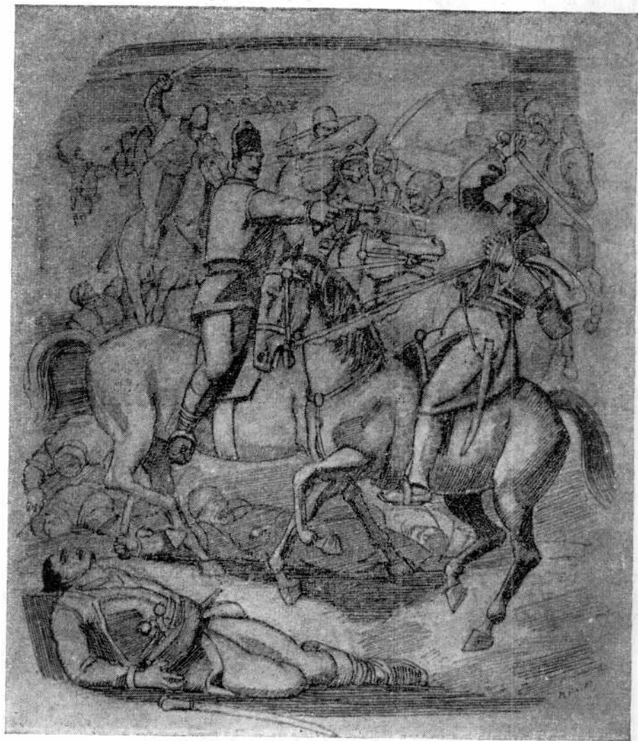
Мирко Рачки, БОЈ НА МИШАРУ (Народни музеј у Београду)