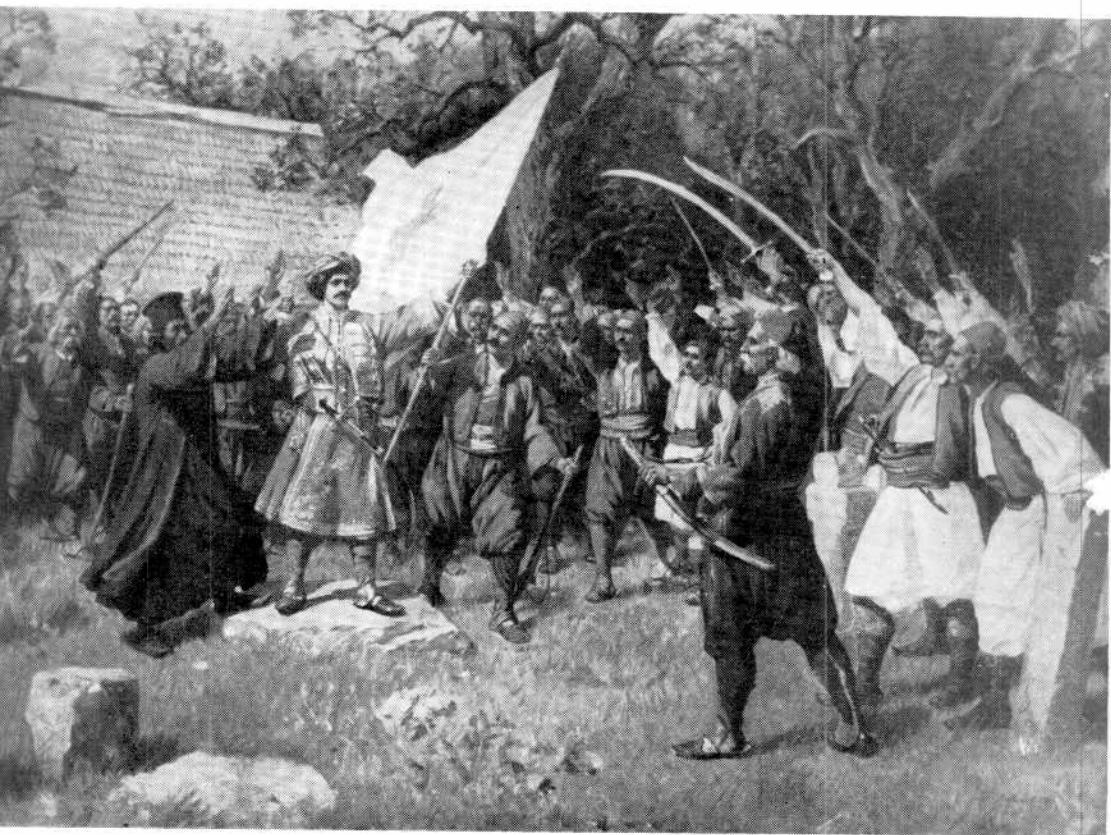
Паја Јовановић, ТАКОВСКИ УСТАНАК (Народни музеј у Београду)