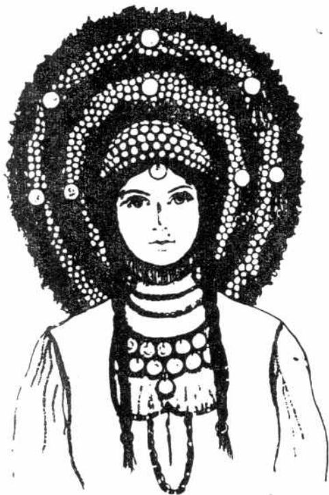
ТАРПОШ (Етнографски музеј у Београду)

да уђе на каква врата, онда треба да се сagne и да укoси главу. Тарпош је оплетен од бијеле лозе, па је на лозу навучена велика капа од црвене чохе; по чoси је пришивена шамија (тако да се чоха и не види), а преко шамије прибодена иглама (трепчанима и колачарама) бијела марамица, која је спријед сва искићена парамa, трепчанијем иглама, смиљем и ружама (начињеним): гдје-које газдинске жене носе и калицу спријед; а младе начине наo-коло око свега тарпоша као вијенац од руже и од смиља; остраг виси низ леђа један крај од шамије (накићен парамa и осталијем бијелијем новцима) и зове се перо . Прошавшијех година (од 1803—1814) тарпоши су готово сасвијем укинути, и постале су мјесто њих мање капе, с којима је лакше бјежати по шуми.