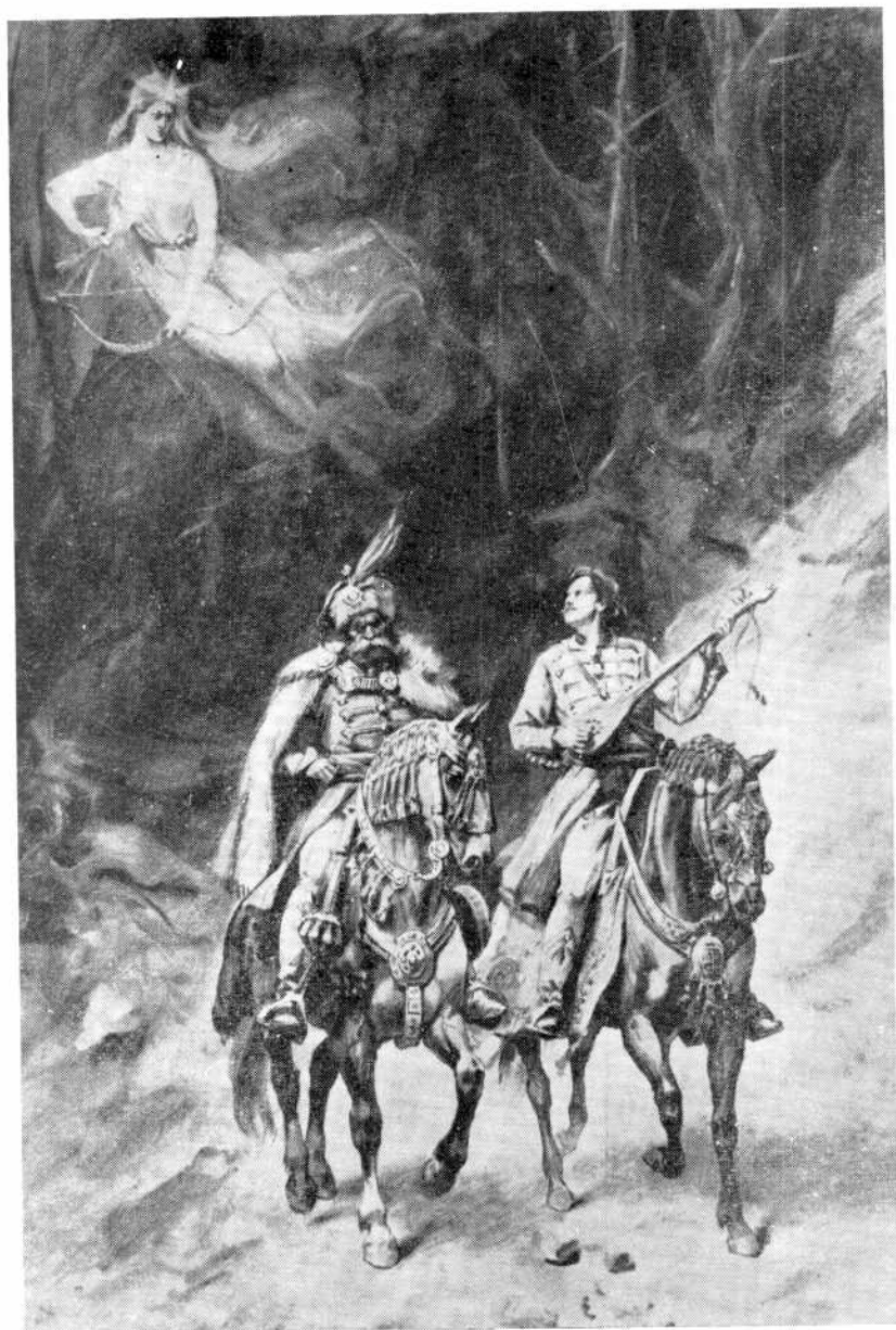
Паја Јовановић, КРАЉЕВИЋ МАРКО И МИЛОШ ОБИЛИЋ (Народни музеј у Београду)