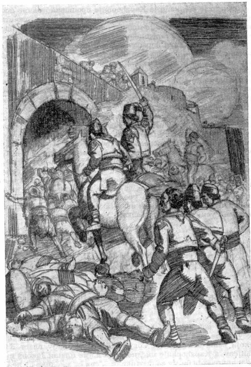
Мирко Рачки, ЗАУЗЕЋЕ БЕОГРАДА (Народни музеј у Београду)