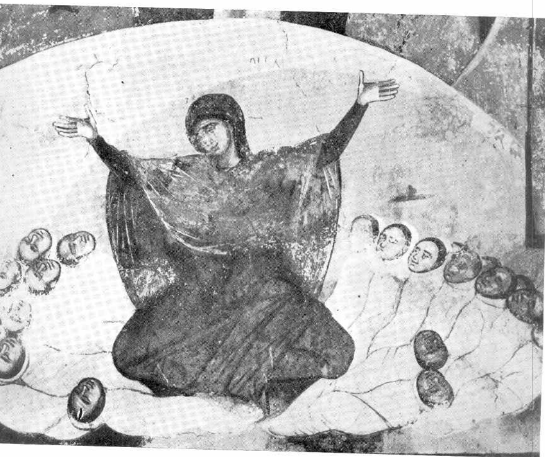
ПЛАЧ РАХИЛЕ (Фреска из Марковог манастира)