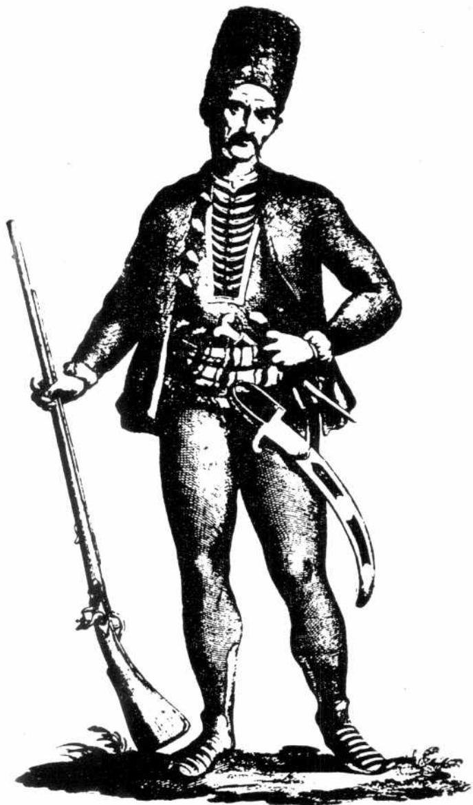
ХАЈДУК СТАНИСЛАВ СОЧИВИЦА

(Прештампано из: И. Ловрић, Биљешке о путу у Далмацију од Алберта Фортиса и живот Станислава Сочивице. Загреб, 1948.)