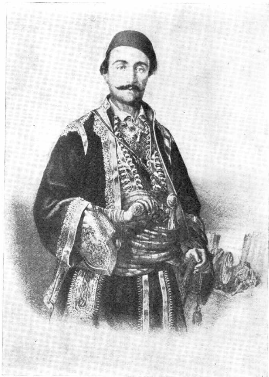
Анастас Јовановић, ХАЈДУК ВЕЉКО (Галерија Матице Српске у Новом Саду)