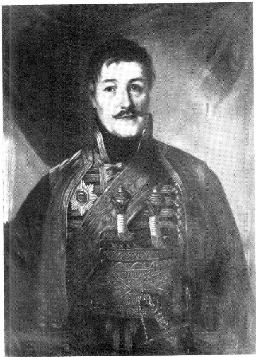
Урош Кнежевић, КАРАЂОРЂЕ (Народни музеј у Београду)