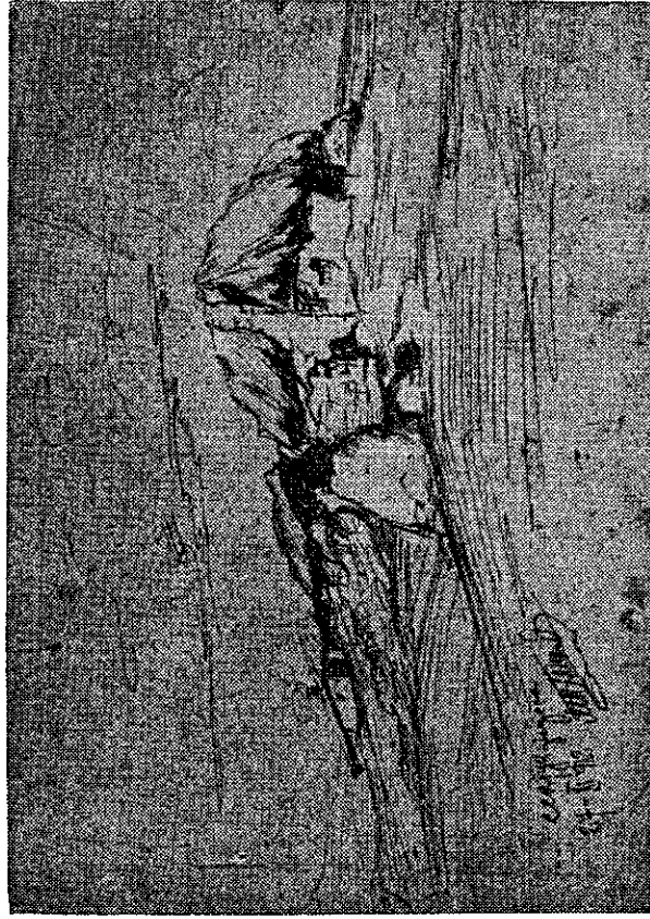
Сл. 1 — Штаб Тимочке дивизије I позива код с. Секлун приликом опсаде Једрена

У дивизијској резерви код с. Возгача био је бугарски 55. пук све до 12. новембра, када је 56. пук са штабом бригаде пребачен на леву обалу Тунце, а 55. посео његов положај. Тада је у дивизијску резерву упућен 2. батаљон 13. пука са једним батаљоном 7. пука II позива (из армијске резерве). Тако је и остало све до доласка допунских батаљона, када су они први враћени у састав својих пукова.