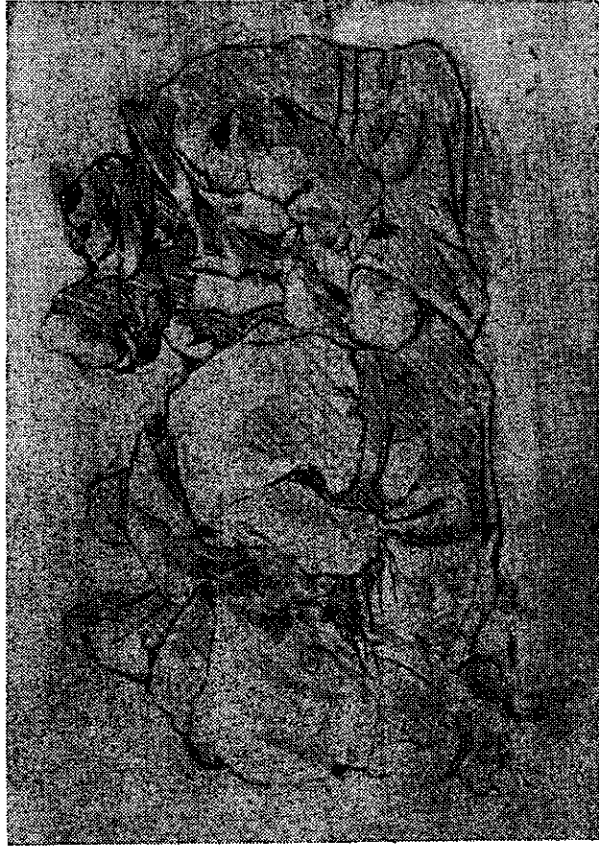
Сл. 2 — На демаркационој линији — састанак српских и турских војника за време примирја (Рађ академског сликара Милише Глишића)

О тешком стању код Турака могло се закључити и из разговора са њиховим официрима и војницима. Тако се 10. јануара појавило код предстраже 1. баталјона 4. прекобројног пука шест турских официра. У разговору који се водио на француском језику Турци су се жалили на досаду, желећи да се рат једном сврши. Чули су да ће мир бити закључен у року од три дана и да ће тада кренути за Цариград.