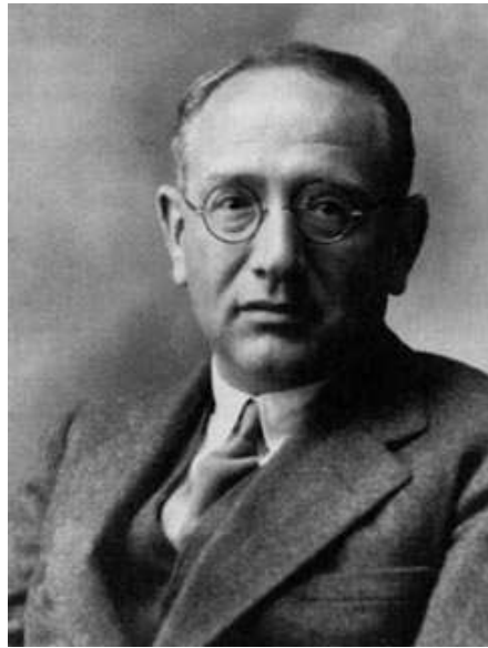
Слика 1. George Polya

Рођен: 13. децембра 1887. године у Будимпешти, Мађарска Умро: 7. септембра 1985. године у Пало Алту, Калифорнија, САД