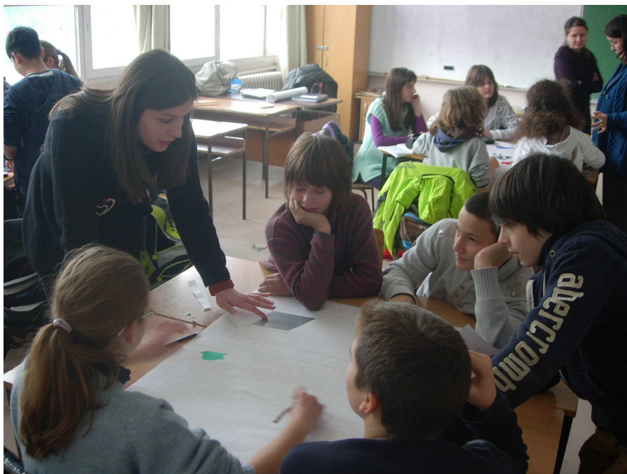
Слика 4. Наставник даје инструкције ученицима

У петом задатку ученици су требали да формулишу теорему о збиру унутрашњих углова четвороугла и да је докажу. Добили су упутство да нацртају дијагоналу четвороугла. Уз помоћ упутства три групе самостално су доказале теорему, одмах су се сетили да је четвороугао дијагоналом подељен на два троугла, и да је збир унутрашњих углова троугла 180^\circ . Уочили су да је угао четвороугла подељен дијагоналом на два угла, који припадају различитим троугловима. И када су сабрали углове оба троугла добили су збир унутрашњих углова четвороугла. Остале две групе наводила сам да уоче шта се добија када се четвороугао подели дијагоналом, и шта знају о збиру унутрашњих углова троугла. Па су и они доказали теорему.