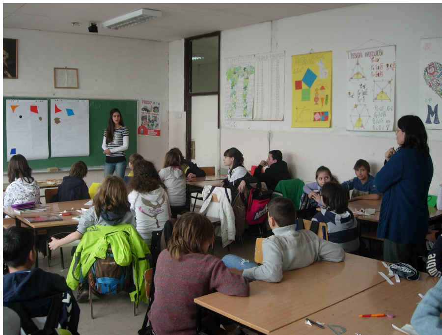
Слика 5. Презентовање решења на табли

Након свих урађених задатака, групе су бирале свог представника који је презентовао решење одређеног задатка на табли.