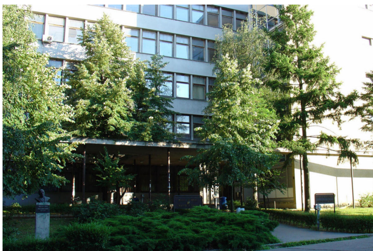
Слика 5. Зграда Института за физику и математику. На првом спрату, у кабинету директора 1974. године основан је АДНОС.