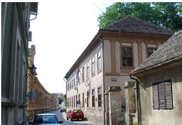
Слика 2 . Виша Педагошка школа била у овој згради која се налази у тзв. Николајевској порти у Новом Саду.