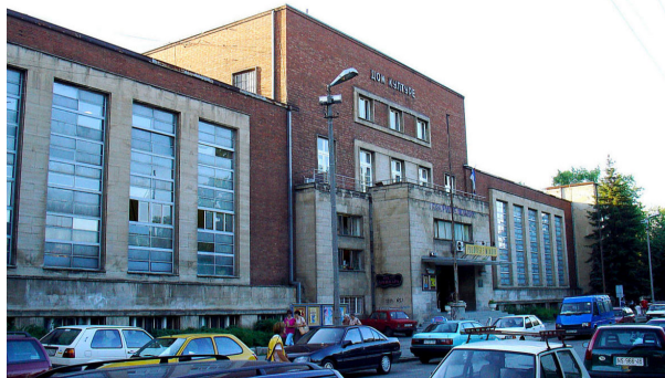
Слика 1. Дом Културе у Новом Саду, било је место где је проф. Ђулум одржао бројна предавања.

Његов допринос у развоју образовања у Војводини је веома велик и немерљив.